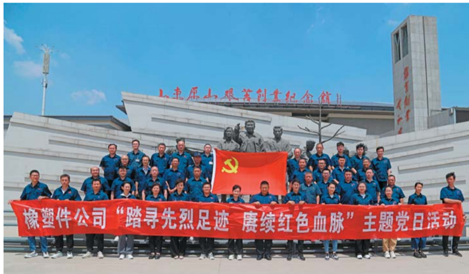
近日，济南橡塑件公司党委组织党员、入党积极分子到淄博原山艰苦创业教育基地和焦裕禄纪念馆开展红色教育活动。